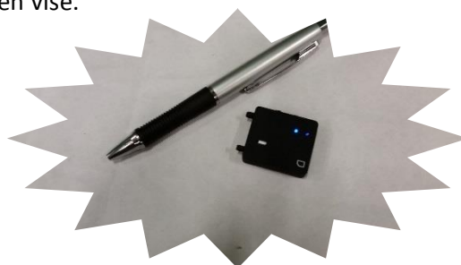
Her ser vi brikkens størrelse i forhold til en penn. Brikken veier 8 gram.

Når du er sluppet på slipp, virker utstyret ved at du når som helst kan sende en sms (fra mobilen din) til duen som har brikken. Du får da tilbake en kartposisjon som vises på kartet, uansett hvor i verden du måtte befinne seg. Brikken kan festes på beinet til duen, eller limes fast til ryggen med korttidslim (spesial lim).