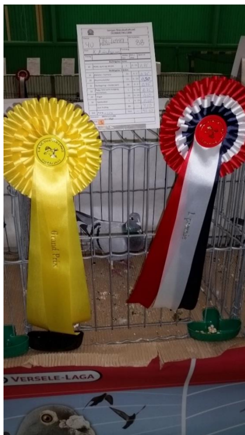
GRAND PRIX DUEN: Knut Austreim med due 14-10987U (95.50p)