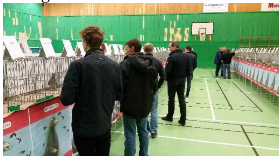
Figur 1 Utstillingen var meget godt arrangert. I samtale med dommerne kom det frem at det var mye bra duer i år. (Kommentar og bilde, RED)

Mye folk, ca. 90 personer tilstede på skalldyraften og fredagens dueaksjon. Litt skuffende at kun 160 duer stilte på landsutstillingen og ingen duer fra Øst eller Sørlandet (Red. hadde med 4 duer, red anm.). Kanskje vi må tenke nytt for å stimulere til deltakelse. Kanskje sette opp en organisert transport som kan frakte duer til /fra arrangementet.