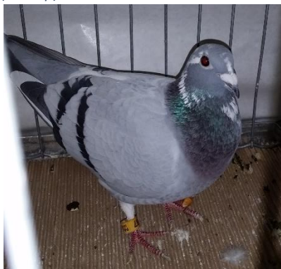
Slik ser en GRAND PRIX vinner ut.