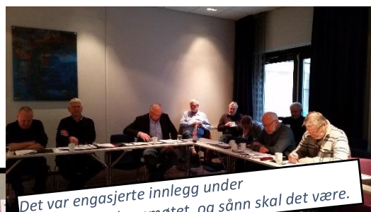
Det var engasjerte innlegg under representantskapsmøtet, og sånn skal det være.

Ankomstdagen vartet arrangøren opp med et fantastisk skalldyrbord i utstillingslokalet. La meg si det slik; Ferskere og bedre skalldyr får du ikke! (Kommentar og bilde, RED)