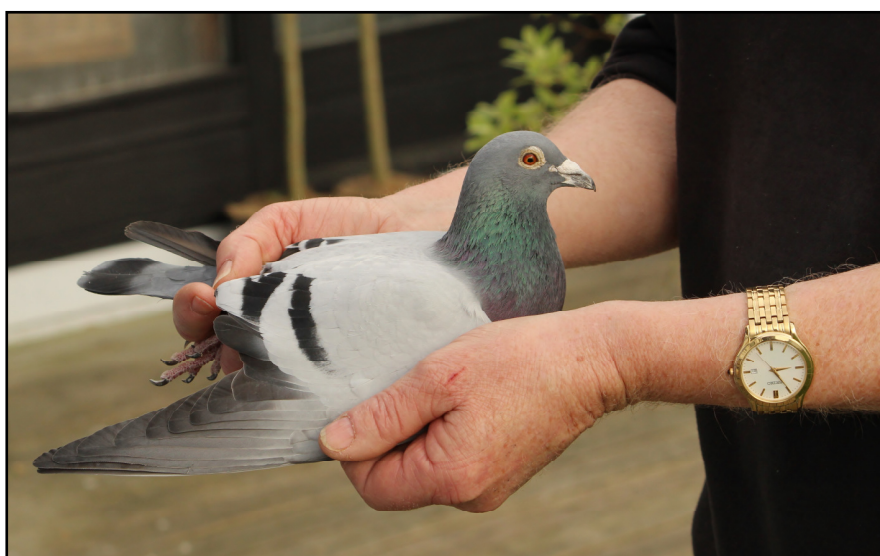
Regionsvinner Antwerpen 2013. 026-11-0074.