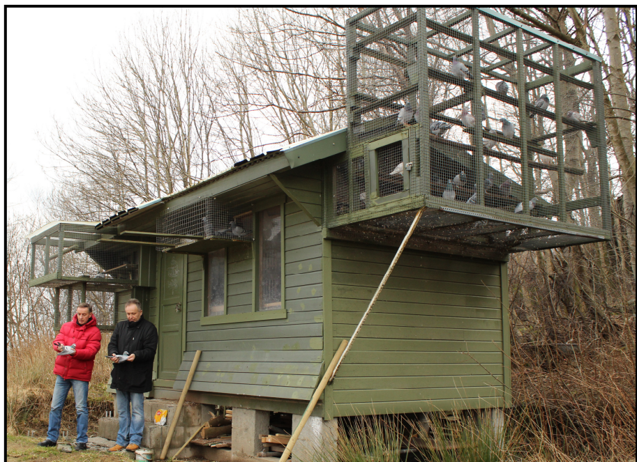
Dueslaget til Reidar Haugland.