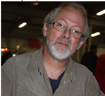
Uten mat og drikke duger helten ikke. Og Roy'en var en sann helt på turen, utenpå nærmere de 60, innenfor nærmere de 20 !! Et eksempel til etterfølgelse...selv ungdommene sleit for å holde følge.