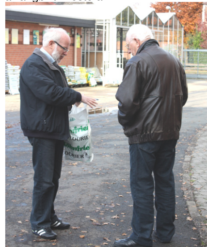
Her utveksles hemmeligheter om hva duen bør få av tilskudd for å sikre seieren!