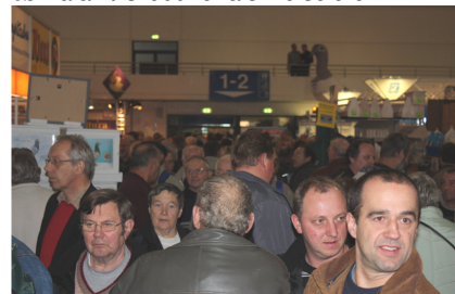
Et lite utsnitt fra inngangen til sal 1 og 2 av i alt de 14 salene som utgjorde årets duemesse i Kassel. Etter sigende er det 40 000 (!) innom messen på to dager. Og hvem sa at menn skyr shopping??