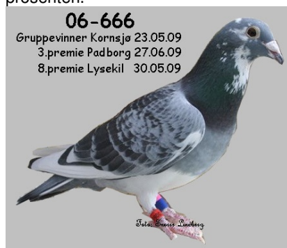
06-666 Gruppevinner Kornsjø 23.05.09 3.premie Padborg 27.06.09 8.premie Lysekil 30.05.09