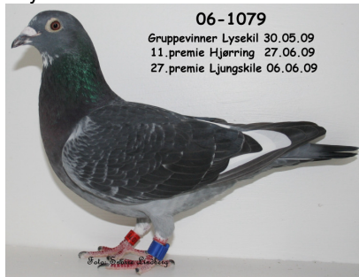
06-1079 Gruppevinner Lysekil 30.05.09 11.premie Hjørring 27.06.09 27.premie Ljungskile 06.06.09