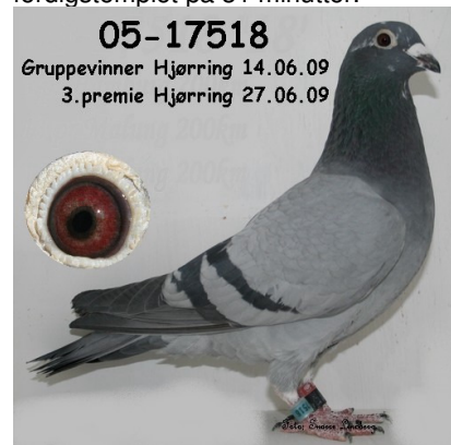
05-17518 Gruppevinner Hjørring 14.06.09 3.premie Hjørring 27.06.09