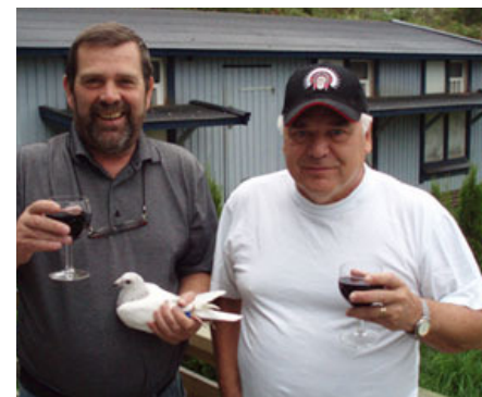
Gratulerer med mesterskapene i 2008!