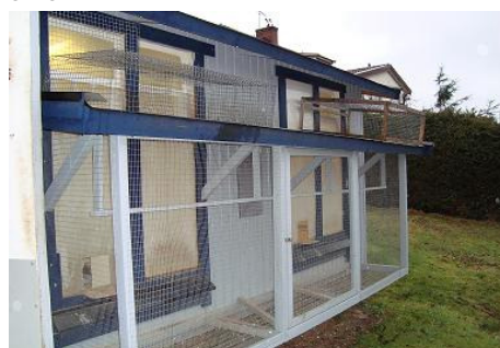
Konkurranseslaget med voliére

Teamet har med stor glede anvendt det naturlige systemet, da det har passet dem utmerket framfor alt på de litt lengre distansene. Før sesongen 2008 besluttet de sig for å prøve enkemethoden. 14 hanner ble utvalgt, 12 ettåringer og to toåringer. Resultatet ble over en hver forventning, spesielt på de korte slippene. Dessuten kunne man nå utnytte hannene ved flere konkurranser. Kommende sesong (2009) har teamet blitt enige om å prøve på det totale systemet med 24 hanner og 24 hunner. På det naturlige slaget, som de først og fremst kommer til å bruke på de lengre avstandene, sitter det 10 par. Hvorfor alle disse duer? Gösta og Dan har konstatert at det i løpet av de siste år har det blitt vanskeligere å få hjem sine duer fra konkurransene, så det er altså en gardering i tilfelle noe skulle gå galt.