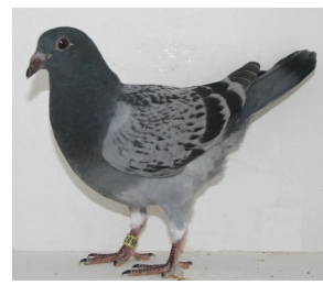
9507: A. & A. Knudsen, gruppe 7