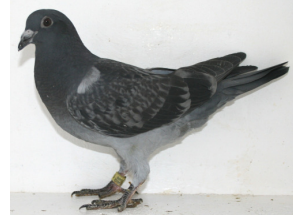
11160: Geir Jondal, gruppe 8