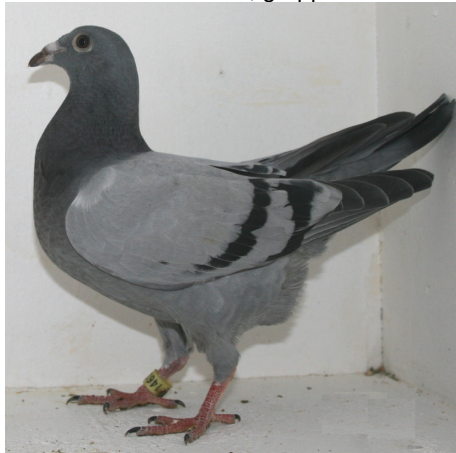
14638: Frode Brakstad, gruppe 16