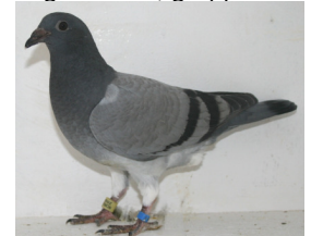
9339: J & T Fjellheim, gruppe 7