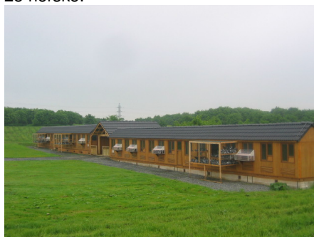
Slik ser One Loft- slaget ut i Barenton

479 duer fra 20 land er nå levert i Barenton-Buray i Frankrike, av dem er 25 norske.