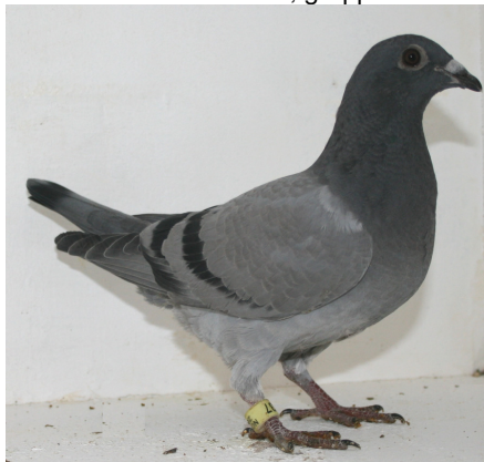
14637: Frode Brakstad, gruppe 16