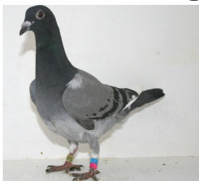
4173: Gunnar Hatlelid, gruppe 5