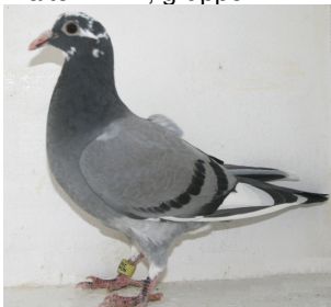
511: Snorre & Marianne, gruppe 1