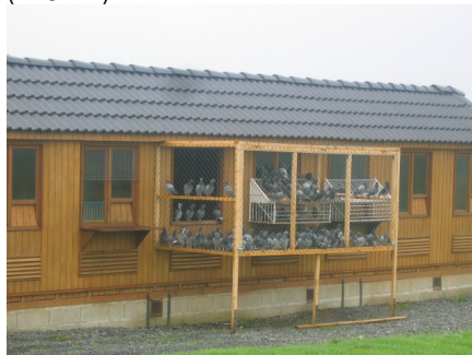
Slaget er innredet med flotte luftige voliérer.

5. Finaleslippet i verdensmesterskapet 2009 foregår den 5 September enten fra Poitiers (415 km) eller fra Riom (416 km).