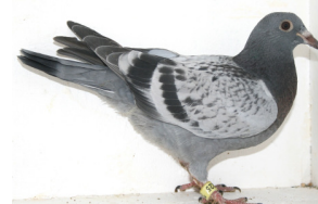
10225: Rolf T. Bolme, gruppe 8