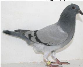
8969: Ole Gjermundsen, gruppe 7