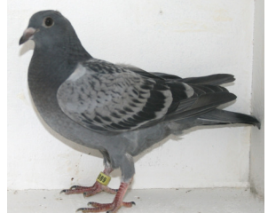
2089: Dagfinn Iversen, gruppe 3