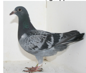
11222: Ingvar Kluge, gruppe 8