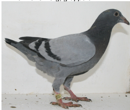
14166: Martin Sævareid, gruppe 14