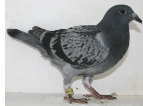
9508: A. & A. Knudsen, gruppe 7