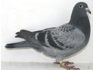
468: Walter Kilvik, gruppe 1