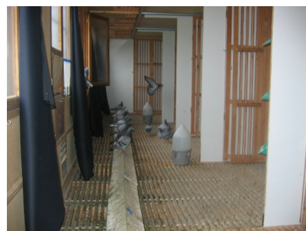
Her fra slagets interiør. Legg merke til de svarte gardinene som gjør det mulig å mørklegge hele slaget.

Den 26. juni er statusen slik at det dessverre er tre av de 25 norske duene som ikke lenger er på slaget. Det vil si at Norge nå har 22 duer tilbake. Går du inn på nettsiden vil du til enhver tid kunne holde deg oppdatert om hvilke duer som er på slaget. Lykke til Norge!