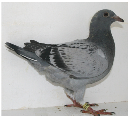
12270: Rune Berg, gruppe 9