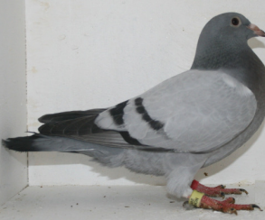
11754: Jarluf Lomeland, gruppe 8