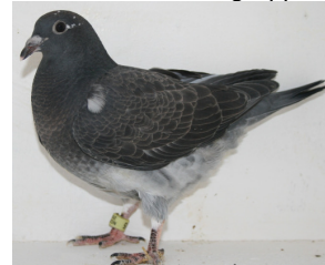
9805: Waaler & Helgesen, gruppe 7