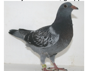
9149: Bjørn Myhra, gruppe 7