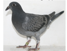
9202: Roger Olsen, gruppe 7